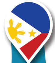
สาธารณรัฐ ฟิลิปปินส์